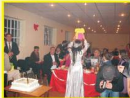
საახალწლო მეჯლისი უნივერსიტეტის კაფე-ბარში